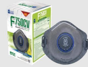
F-750CV P2 活性碳口罩(帶閥)