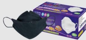
NP-4DBK 韓版折合型時尚黑 (25片裝)