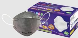
NP-4DC 韓版折合型活性碳口罩 (25片裝)