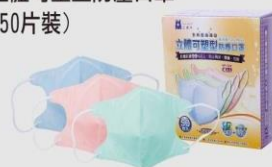
NP-3DX 立體可塑型防塵口罩 (50片裝)