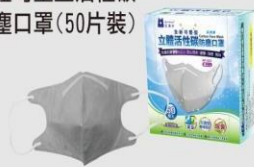
NP-3DXC 立體可塑型活性碳 防塵口罩(50片裝)