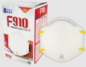
F-910 N95 防塵口罩