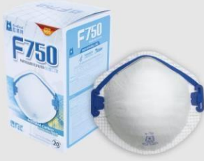
F-750 P2 防塵口罩