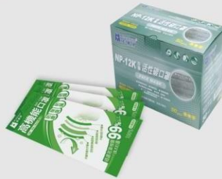
NP-12K 活性碳口罩(單包裝)