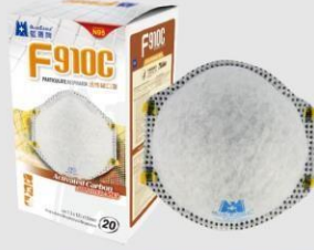
F-910C N95 活性碳口罩