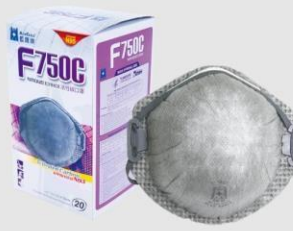
F-750C P2 活性碳口罩