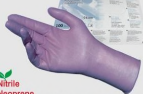
MAPA 994 三材質複合手套

Nitrile Neoprene 天然乳膠 L.25.5cm Th.0.15mm