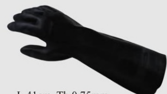
MAPA 450 防酸鹼溶劑 手套