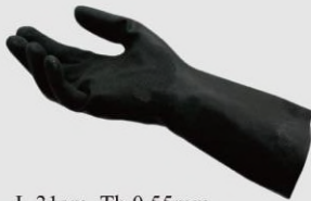
MAPA 401 防酸鹼溶劑 手套