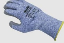
MAPA 586 防割手套(精密防滑) 4543