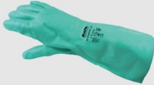
MAPA 491 防溶劑手套