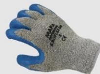
MAPA 840 防割手套(防熱防滑) 3543 X2000X