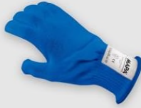
MAPA 838 防割手套(食品級)(支) 254X