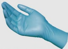
MAPA 997 NBR手套