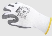
MAPA 579 防割手套(輕量型) 4343