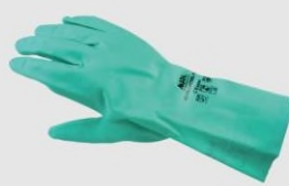
MAPA 492 防溶劑手套