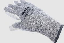
MAPA 836LC 防割手套(手掌皮革) 4543 X1000X