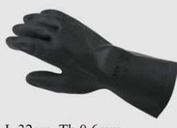
MAPA 415 防酸鹼溶劑 手套