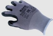
MAPA 553 工作手套(輕量型) 4121