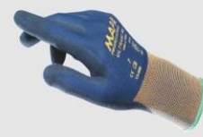
MAPA 500 工作手套(防油防滑) 4121