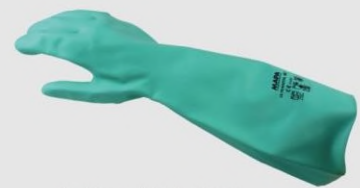
MAPA 480 防溶劑手套