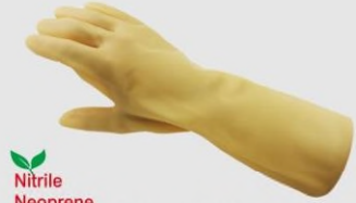
MAPA 517 潔淨室用手套

Nitrile Neoprene 天然乳膠 L.25.5cm Th.0.15mm