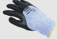
MAPA 582 防割手套(防油防滑) 4543