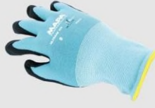
MAPA 510 工作手套(乾淨環境) 4131